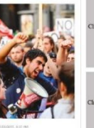
Việt Nam là nền kinh tế... Mối hợp tác napa nông