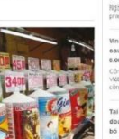
20 năm kinh tế phát triển... Giới thiệu sản phẩm