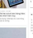
AGIAN là ngôi vực Trung... Quốc sản phẩm