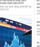
Hiển thị đang triển... Theo Phó Tổng cục