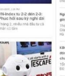
KBC bán hơn 1.200... Ocean Group góp